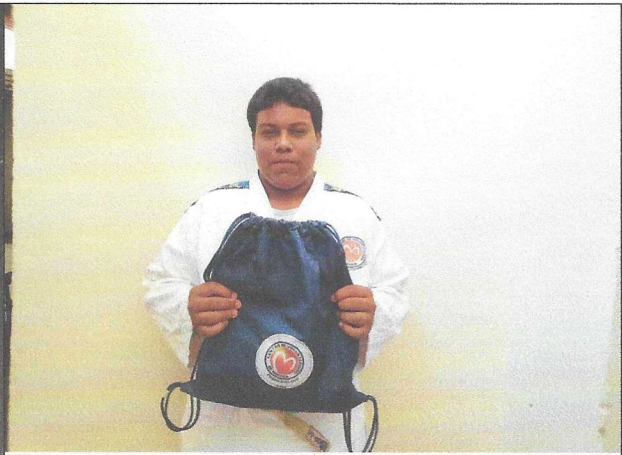
Aquisição de Uniformes, Kimonos e Mochilas