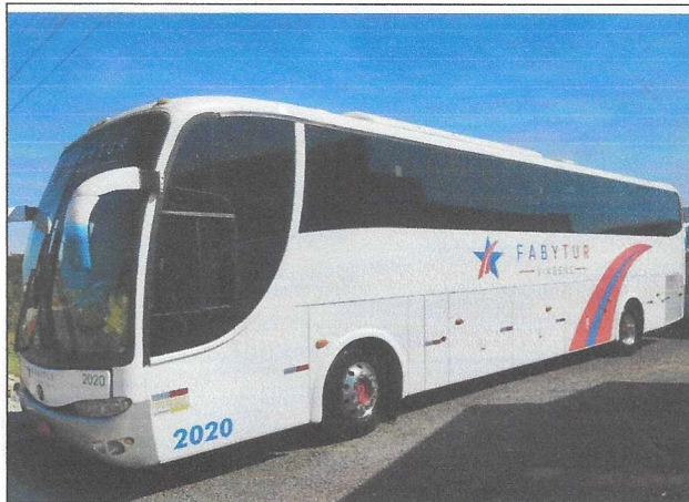
Transporte de Participantes