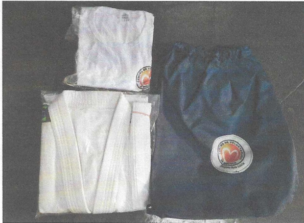
Aquisição de Uniformes, Kimonos e Mochilas