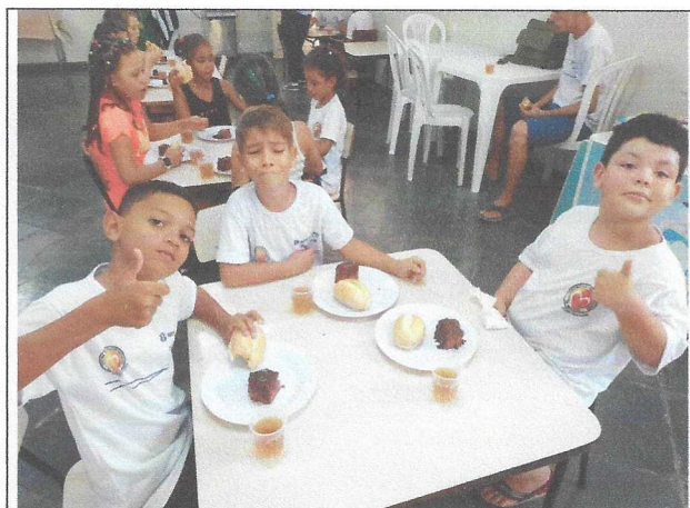
Aquisição de Alimentos