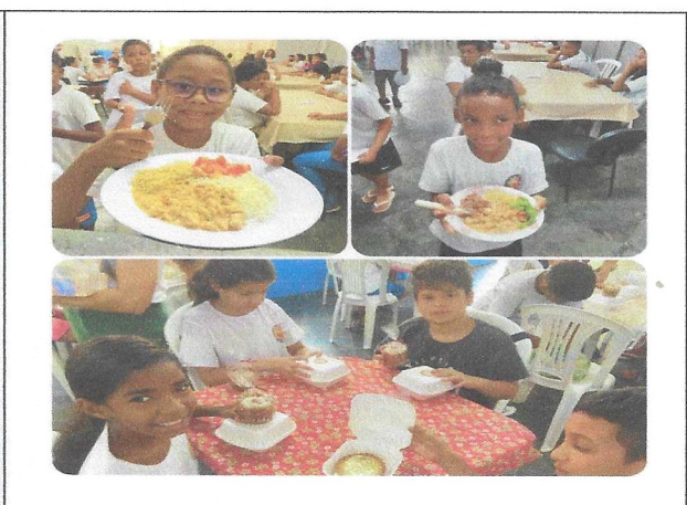
Aquisição de Alimentos