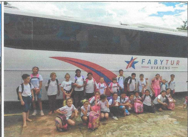
Transporte de Participantes